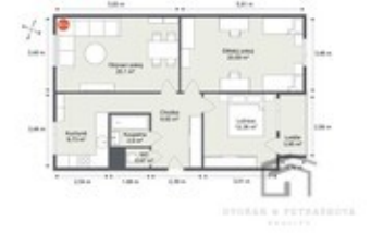
BYGGA & PETÄÄRÖYÄ KIVINKI