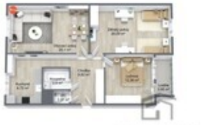
BYGGA & PETÄÄRÖYÄ KIVINKI