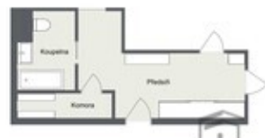
DIJALAK & PETRAŠKOVIČ REKLAMA