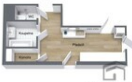
DIJALAK & PETRAŠKOVIČ REKLAMA