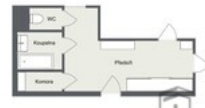
DIJALAK & PETRAŠKOVIČ REKLAMA