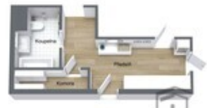
DIJALAK & PETRAŠKOVIČ REKLAMA