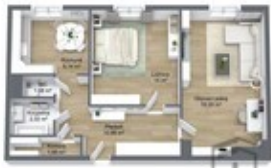
DIJALAK & PETRAŠKOVIČ REKLAMA